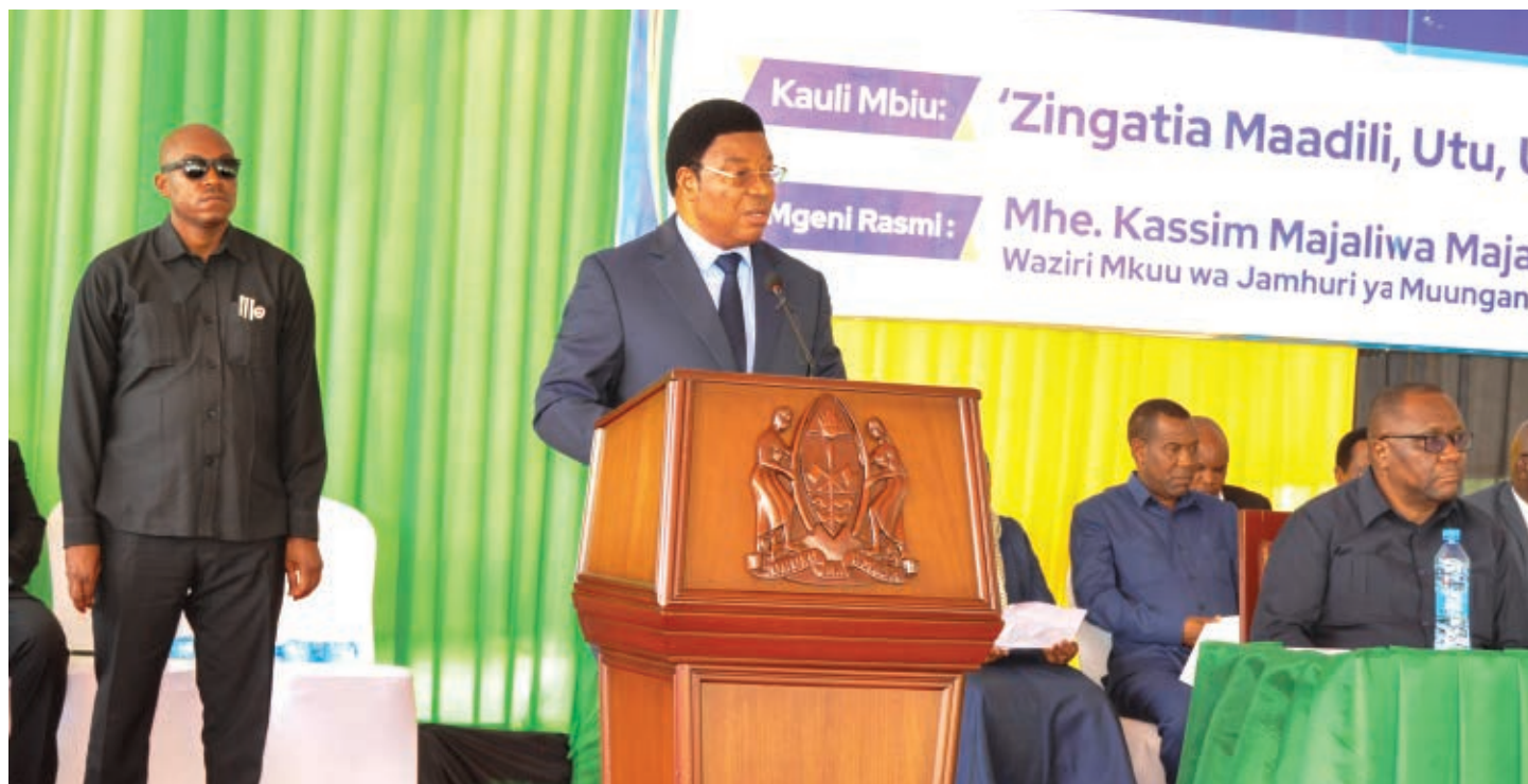
Waziri Mkuu wa Jamhuri ya Muungano wa Tanzania, Mhe. Kassim Majaliwa Maja (Mb) akihutubia katika maadhimisho ya kilele cha wiki ya Maadili na Haki za Binadamu ambayo yalifanyika jijini Dodoma katika viwanja vya Nyerere Square tarehe 10, Desemba 2023.

Jamhuri ya Muungano wa Tanzania huadhimisha Siku ya Maadili na Haki za Binadamu kila tarehe 10 Desemba kuanzia mwaka 2016.