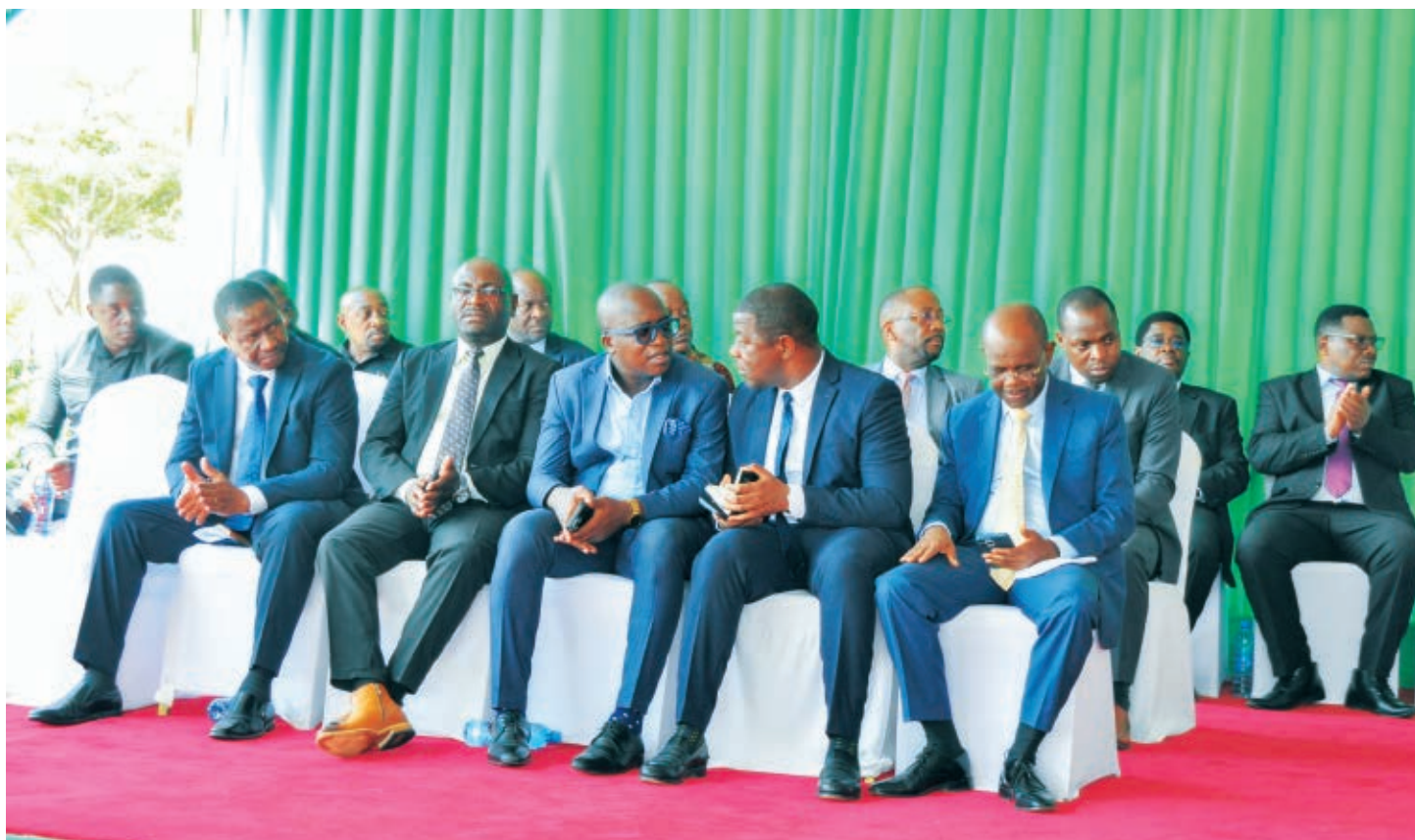
Baadhi ya Mawaziri na Makatibu Wakuu wa Serikali ya Jamhuri ya Muungano wa Tanzania walioshiriki kilele cha Maadhimisho ya Siku ya Maadili na Haki za Binadamu Kitaifa katika viwanja vya Nyerere Square jijini Dodoma tarehe 10 Desemba, 2023