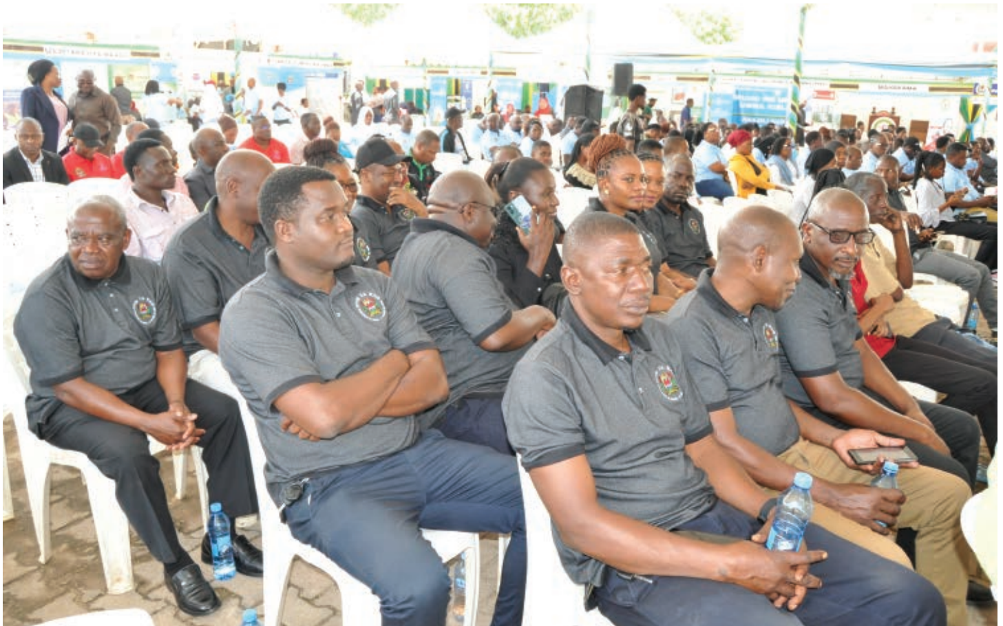
Baadhi ya watumishi wa Ofisi ya Rais, Sekretarieti ya Maadili ya Viongozi wa Umma katika kilele cha maadhimisho ya siku ya Maadili na Haki za Binadamu yaliyofanyika katika viwanja vya Nyerere Square jijini Dodoma tarehe 10, Desemba 2023, ambapo mgeni rasmi alikuwa Waziri Mkuu wa Jamhuri ya Muungano wa Tanzania, Mhe. Kassim Majaliwa Majaliwa.

Maadhimisho ya Siku ya Maadili na Haki za Binadamu mwaka 2023, yalienda sambamba na uzinduzi wa Awamu ya Nne ya Mkakati wa Kitaifa Dhidi ya Rushwa (National Anti-Corruption Strategy and Action Plan – IV).