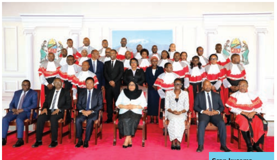
Rais wa Jamhuri ya Muungano wa Tanzania, Mhe. Dkt. Samia Suluhu Hassan akiwa katika picha ya pamoja na Viongozi mbalimbali pamoja na majaji wa Mahakama ya Rufani na majaji wa Mahakama kuu mara baada ya kuwaapisha majaji hao Ikulu ya Dar es Salaam, Septemba 14, 2023.