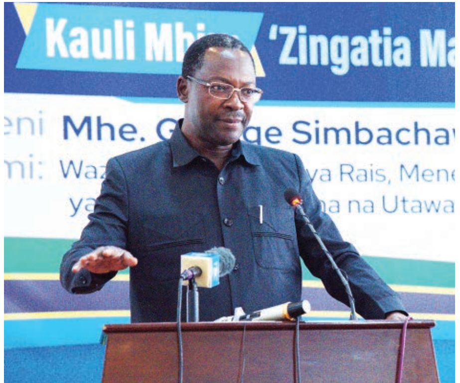
Waziri wa Nchi, Ofisi ya Rais, Menejimenti ya Utumishi wa Umma na Utawala Bora, Mhe. George Simbachawene (Mb) akiongea na wana kongamano (hawapo pichani) la jukwaa la kitaifa la wadau wa juhudi dhidi ya rushwa lililofanyika tarehe 04 Desemba, 2023 ikiwa ni sehemu ya maadhimisho ya wiki ya Maadili na Haki za Binadamu nchini ambapo kilele chake kilikuwa tarehe 10 Desemba, 2023.

“Ni Imani yangu kuwa wadau wa sekta zote kwa umoja wetu tutatenda haki kwa mada zitakazowasilisha kwenye jukwaa ili kuweza kutoka na maazimio yatakayosaidia juhudi za kuzuia Rushwa