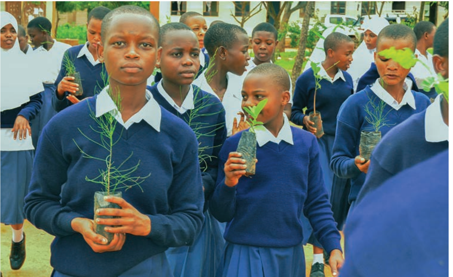
Wanachama wa klabu ya Maadili ambao ni Wanafunzi wa shule ya Sekondari Ngh'onganha iliyopo jijini Dodoma wakipanda miti iliyotolewa na Ofisi ya Rais, Sekretarieti ya Maadili ya Viongozi wa Umma Kanda ya Kati. Ofisi ya Rais, Sekretarieti ya Maadili ya Viongozi wa Umma Kanda ya Kati imepanga kutoa miche ya miti kwa shule 150 zenye Klabu za Maadili katika mikoa ya Dodoma na Singida ili kulinda mazingira.