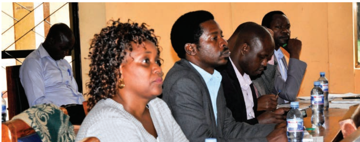
Baadhi ya washiriki wa mafunzo ya maadili wakisikiliza kwa makini mada zinazotolewa katika ukumbi wa Halmashauri ya Muleba yaliyofanyika tarehe 23 Januari 2024.

Aidha mafunzo hayo ya Maadili ya Viongozi wa Umma yamehudhuriwa na Viongozi wa Halmashauri ya Wilaya ya Muleba zaidi ya 100 kutoka katika Idara, Vitengo pamoja na waheshimiwa madiwani wa Halmashauri ya Wilaya hiyo.