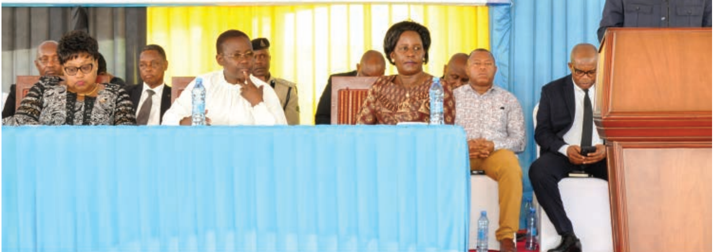
Waziri wa Nchi, Ofisi ya Rais, Menejimenti ya Utumishi wa Umma na Utawala Bora Mhe. George Simbachawene (Mb) akitoa neno la utangulizi katika kilele cha maadhimisho ya siku ya Maadili na Haki za Binadamu. Hafla hiyo ilifanyika katika viwanja vya Nyerere Square Jijini Dodoma tarehe 10 Disemba, 2023